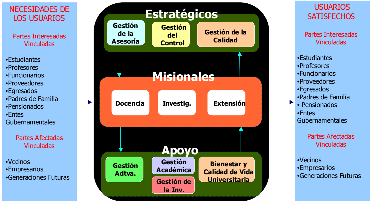
Figura 2. Mapa de Macroprocesos propuesto

A continuación se detalla el Mapa con los procesos propuesto que componen cada Macroproceso.