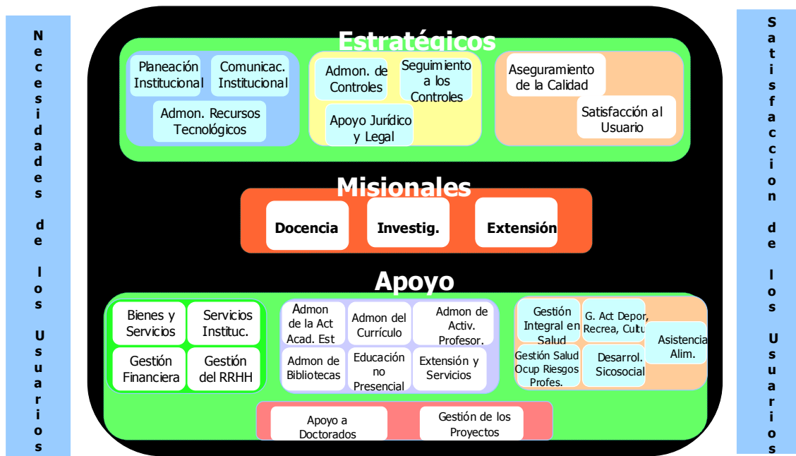
Figura 3. Mapa de Procesos Propuesto

A continuación se detalla el Mapa con los procesos propuesto que componen cada Macroproceso.